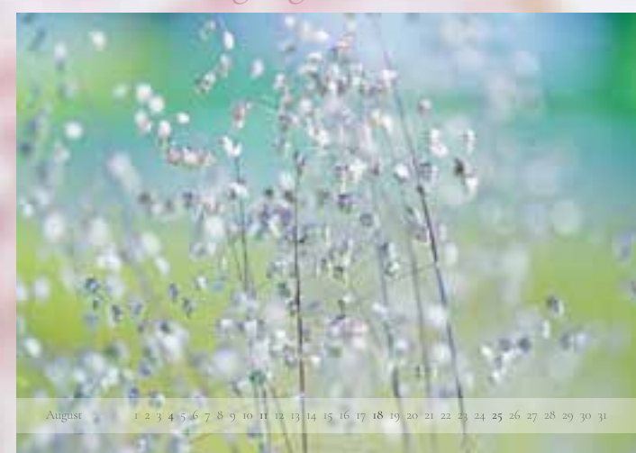
August - „Zittergras“