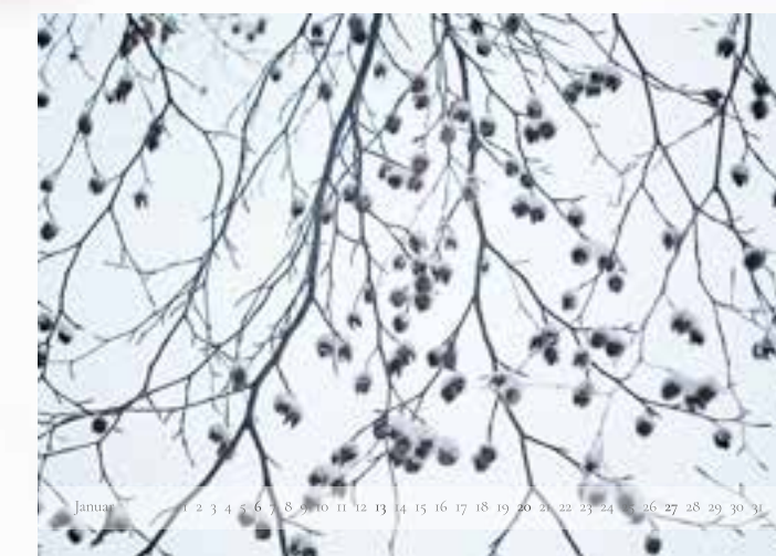
Januar - „Schneebedeckte Bucheckern“