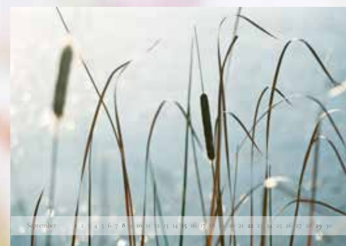
September - „Pompeschi“