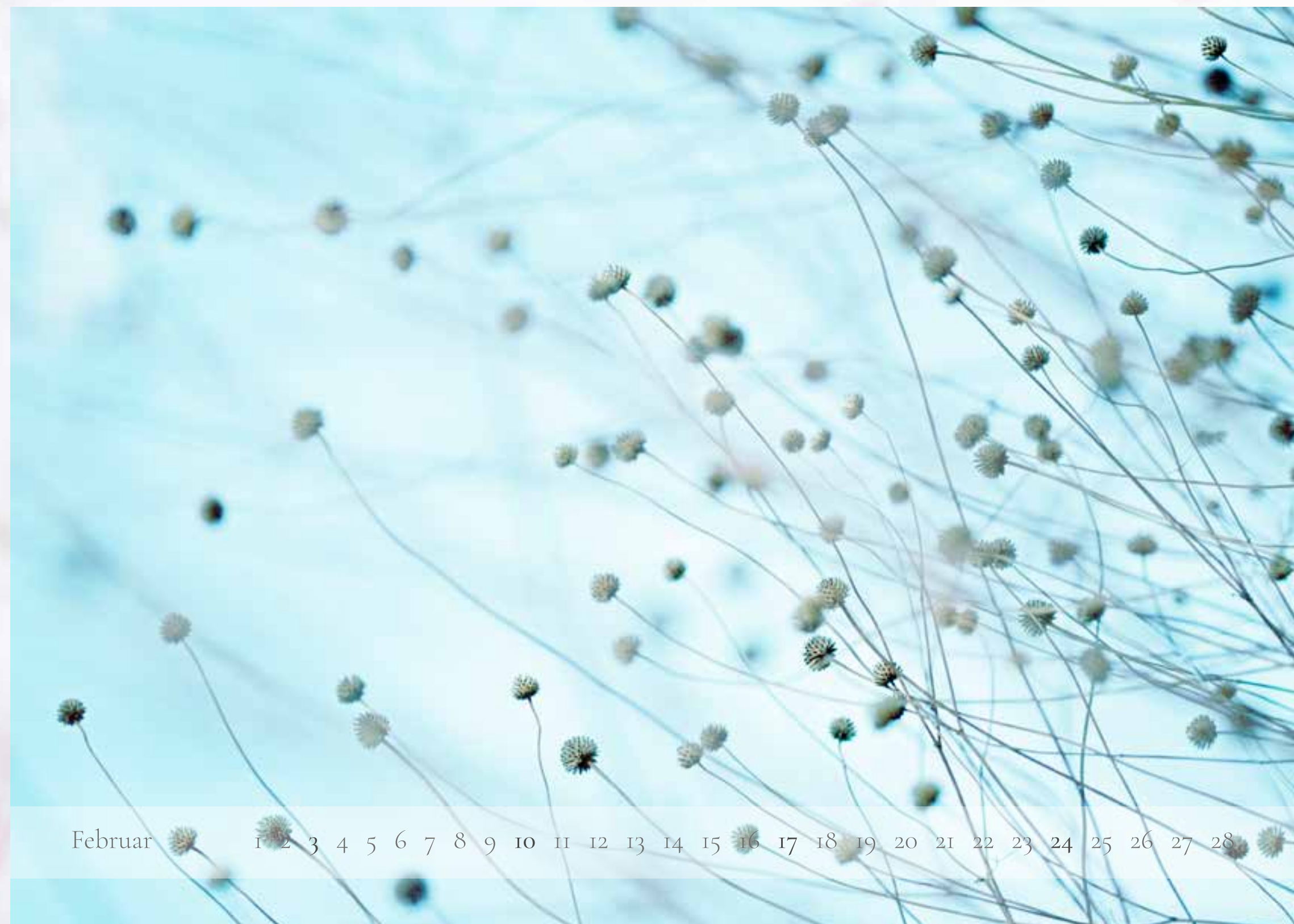
Februar - „Kugelig“