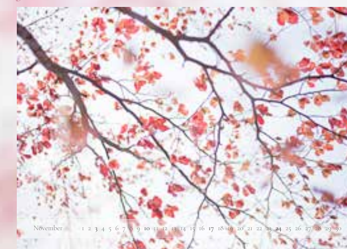
November - „Rotbuche III“