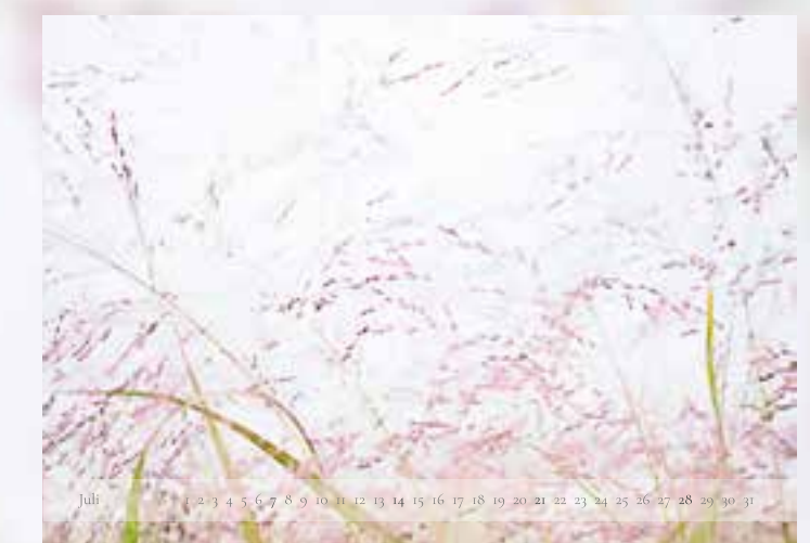
Juli - „Rutenhirse“