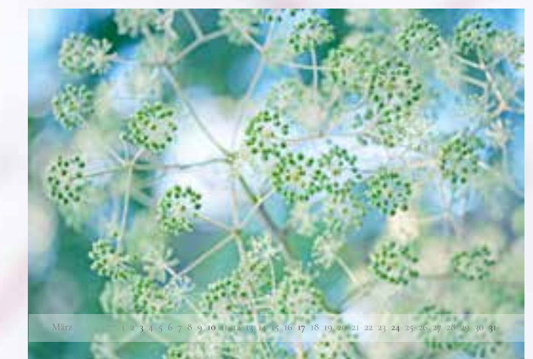
März - „Japanische Schönfrucht“