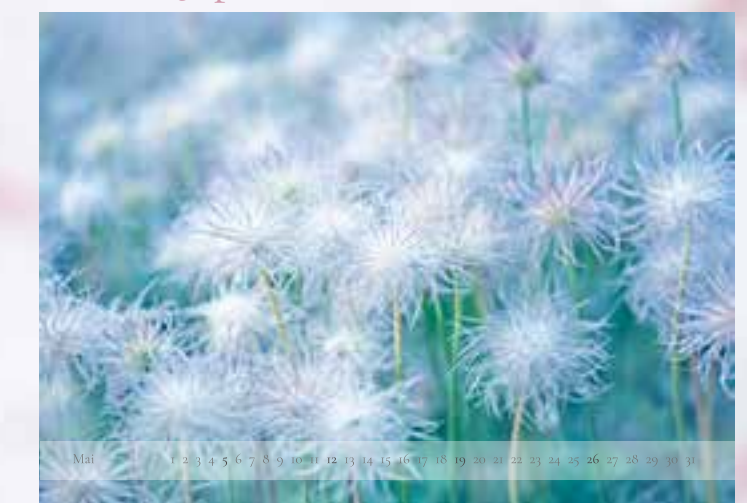
Mai - „Puschel“