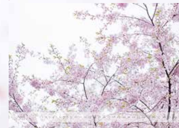
April - „Zartes Erblühen“