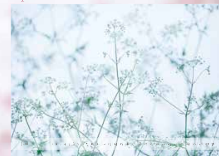
Juni - „Zarter Wiesenkerbel“