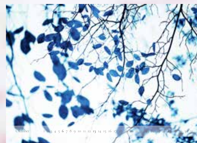
Oktober - „En Bleu“